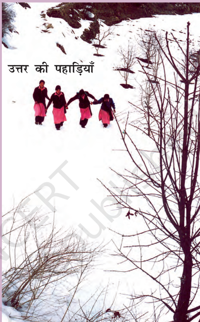
उत्तर की पहाड़ियाँ

देखो हम कैसे स्कूल पहुँचते हैं—मीलों फैली बर्फ़ पर चलकर। हम हाथ पकड़-पकड़ कर, बर्फ़ पर पैर जमाते हुए ध्यान से चलते हैं। ताज़ी बर्फ़ में पैर धँस जाते हैं। अगर बर्फ़ जमी हुई हो, तो फिसल भी सकते हैं।